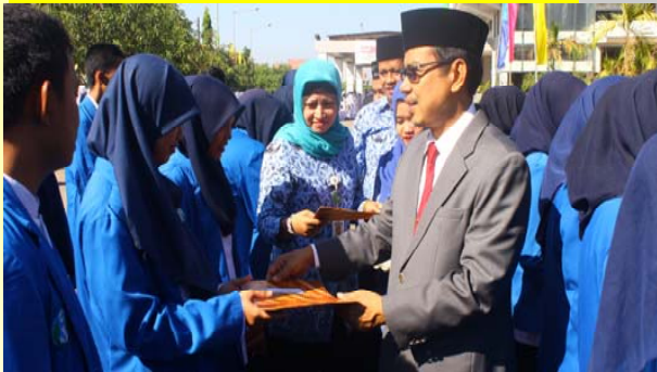
Penyerahan Beasiswa Berprestasi dan Gakin