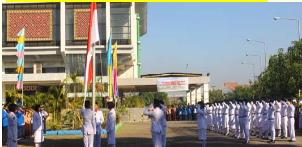
Pelaksanaan Upacara HUT RI Ke-70